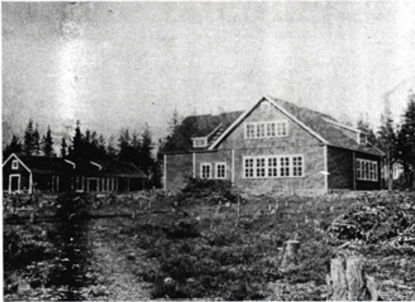
Haitermaan koulu, rakennettu vuonna 1926. Kuva on otettu kesällä 1926, kun pihaa ei vielä ole raivattu.