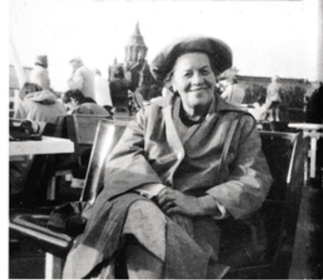
Iloinen kotiinpaluu Islannin Kotiteollisuus-käräjiltä v. 1948.