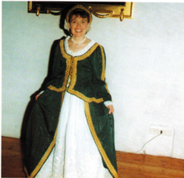
Hämeenlinnan linnan oppaat olivat pukeutuneet kauniisiin historiallisiin pukuihin v. 1996.