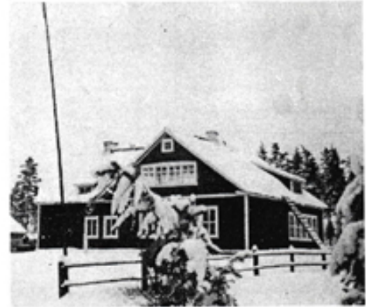
Talvinen kuva Haitermaan koulusta 1930-luvulla.