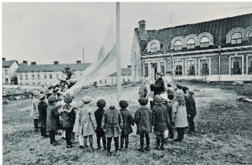
Sedmigradskyn koulurakennus 1920-luku, Sturenkatu 12-14.