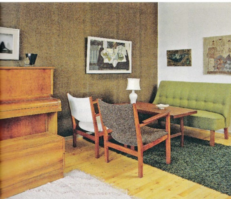
Virkin koti, olohuoneen nurkkaus.