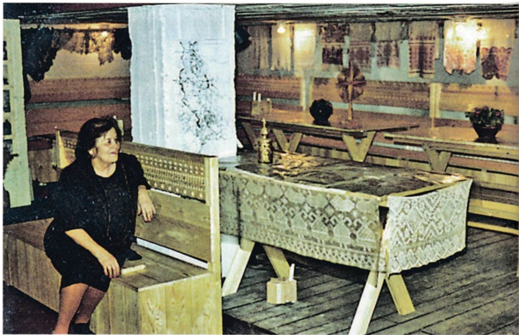
Virkki käsityömuuseo, Merikannontie 3, Aunus-nurkkaus

Ulkomaalaiset vieraansa Typy toi tutustumaan suomalaiseen maaseutuun ja karjalaiseen ruokakulttuuriin. Sopi se meille tai ei. Vieraskirjamme vilisee nimikirjoituksia. Hänellä oli lähes pakko-