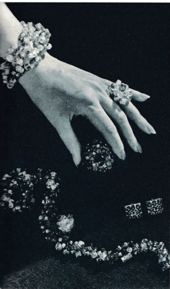
Eeva Taimin suunnittelema koruja

kaidenkutomiseen. Vast'ikään löysin pitsisormikkaiden mallin omin käsin lehdestä v 1944 N:o 2. Aion toteuttaa lapsuudesta tutun mallin uudelleen.