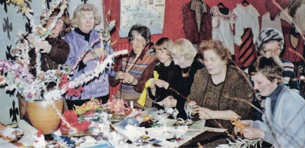
Virpovitsojen valmistusta, museotiloissa, Merikannontie 3

ilmaa!” Katsoin ikkunasta näkyvää krematorion savupilveä.