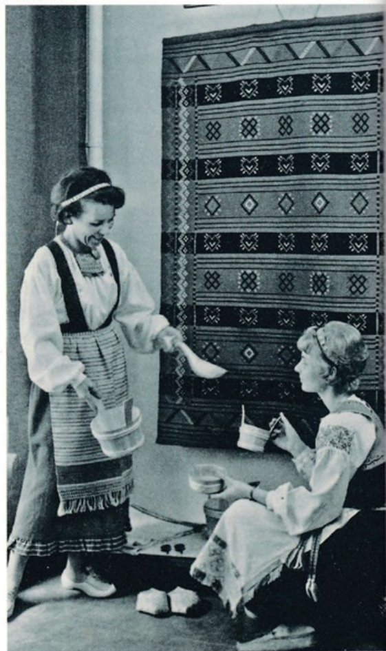
Perinne esittely, Vokki Oy