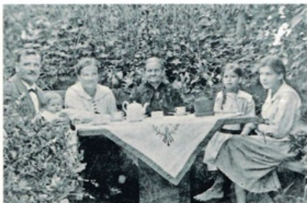
Virkin perhe 1917