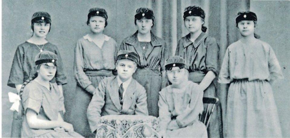
Käkisalmen yhteiskoulu, V luokka 1921

ni paikan Helsingistä vakuutusyhtiö Salaman konttorista, mutta eihän se onnistunut maalaistytölle.