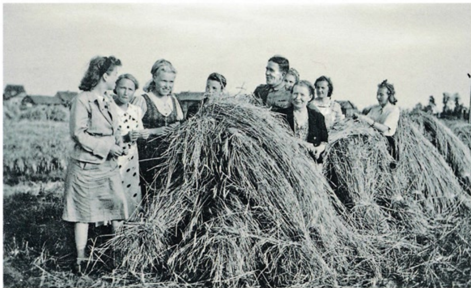
Pellavan lyhteillä Aunuksella.

Tarkoituksena oli perustaa Aunuksen käsityö museo. Työtuvan kevätkuulan yhteydessä 1942 oli museonäyttelyn avajaiset. Valtaosa töistä koostui karjalaisista käspaikoista, ja revinnäisistä. Aunuksessa tapasin vanhoja mummoja, jotka kyynelehtien kertoivat aikoinaan tekemistään matkoista Suomeen. Heidän nyytinsä olivat olleet pulloiltaan pitsejä ja