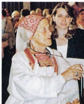
Sakkolan puuvun esittely juhlaseminaarissa 2007.