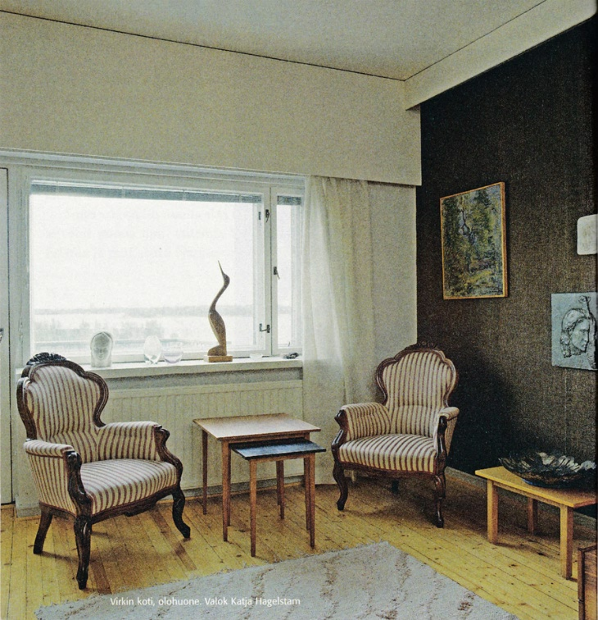
Virkin koti, olohuone.