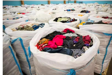
Tekstiilien kierrätettävyyteen vaikuttavat useat asiat, kuten materiaalin laatu. KUVA: VESA-MATTI VÄÄRA

Lounais-Suomen jätehuolto jalostaa suomalaisten kotitalouksien poistotekstiiliä kierrätysraaka-aineeksi uusien tuotteiden valmistukseen.